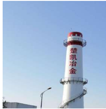
废气治理措施一览表